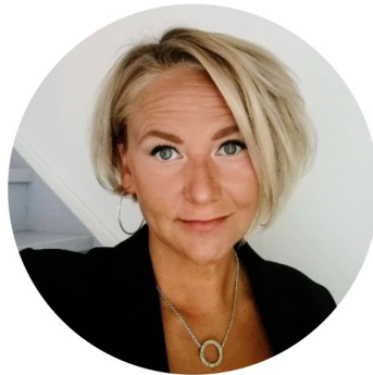
Tuikkis Business Analyst